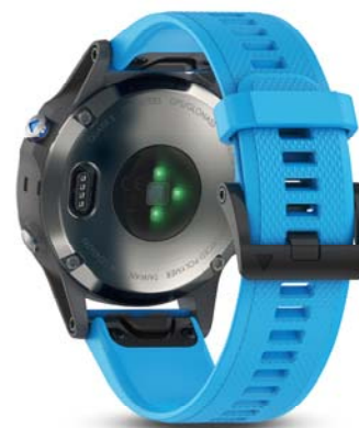
Technologie cardio poignet Garmin Elevate™