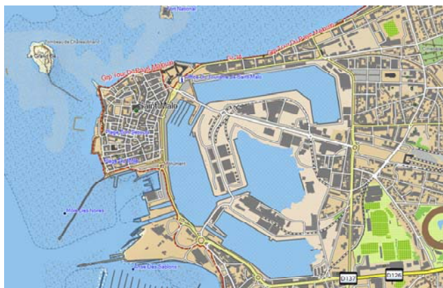
Logiciel Basecamp™ - Détail du littoral – Baie de Saint-Malo

Le célèbre logiciel de préparation et d'analyse d'activités BaseCamp permet à tous les utilisateurs de préparer leur sortie en fonction de l'activité qu'ils souhaitent pratiquer. BaseCamp affiche ainsi clairement l'ensemble des informations proposées par la cartographie Garmin Topo France v4 Pro. Ainsi, un simple clic sur un sentier permet de connaître son type et de visualiser en un instant l'ensemble du parcours.