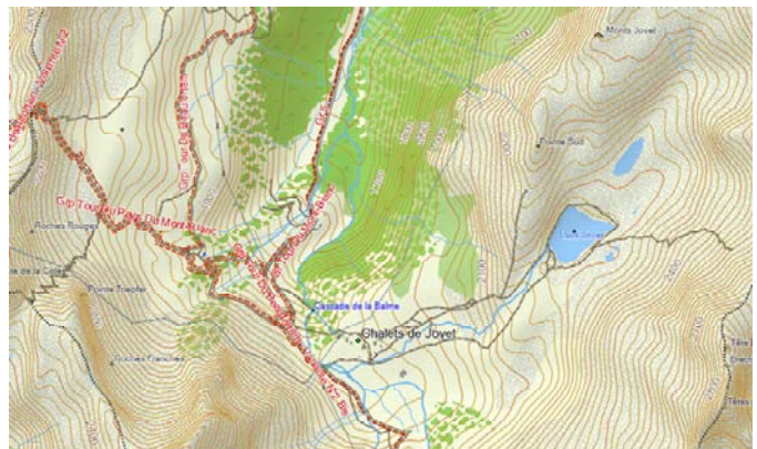
Logiciel Basecamp™ - Courbes de niveaux et chemins – Mont Jouet, Alpes

Ce mode de calcul exclusif à Garmin permet de s'assurer que le parcours que l'on va rencontrer correspond parfaitement à son niveau de pratique, son état de santé ou tout simplement son humeur du moment.